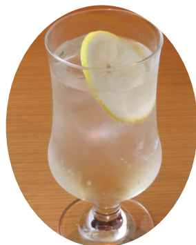
はちみつ ジンジャーソーダ 580円