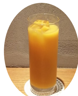
オレンジ ジュース 540円