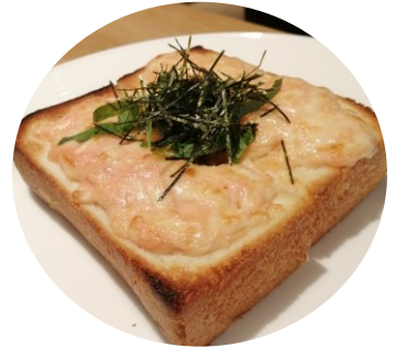
明太マヨチーズトースト 420円