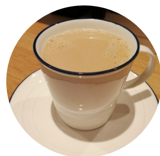
ホットカフェオレ 680円