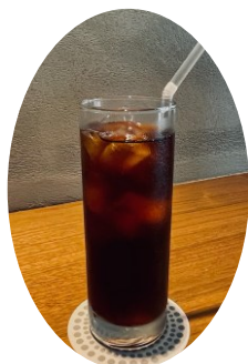
水出しアイスコーヒー 620円