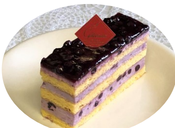
ブルーベリーケーキ