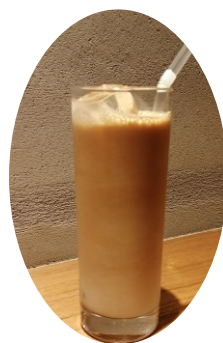
アイスカフェオレ 620円