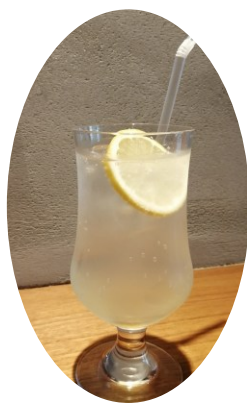
レモンスカッシュ 540円