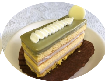
ピスタチオとヘーゼル ナッツのケーキ