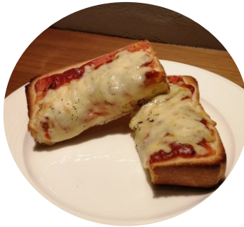
ピザ風チーズトースト 380円