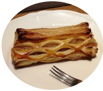
焼きたてアップルパイ 380円