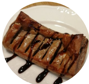
焼きたてチョコパイ 380円